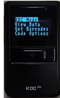
メニュー選択モード画面

本機の左側(KDC200i)また右側(KDC300i)の UP,DOWN スクロールボタンを同時に押すと KDC メニュー選択モードになります。